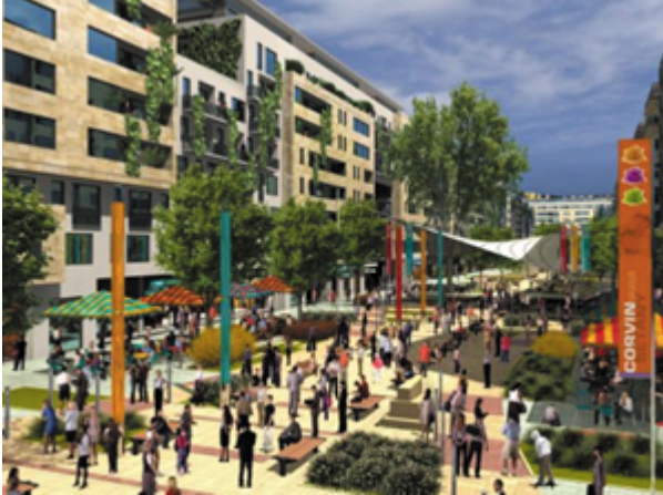
La Promenade Corvin

Si certains projets de construction sont suspendus ou abandonnés (lire page précédente), voici quelques exemples de projets qui, eux, sont bels et bien en